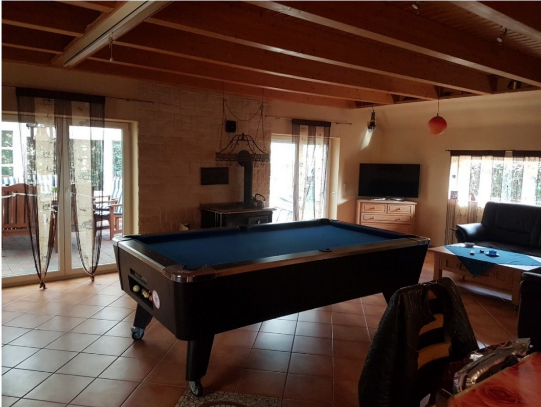
Billardzimmer / Wohnzimmer EG