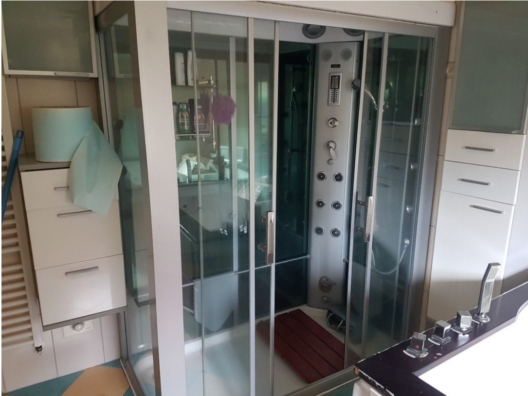
Dusche im Badezimmer EG